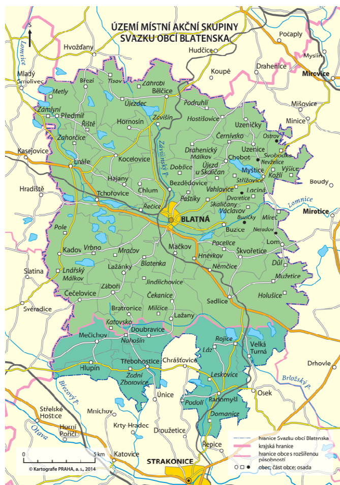
Mapa č. 1 Mapa území, administrativní členění

Území MAS Blatenska sdružuje 32 obcí v severozápadní části okresu Strakonice v Jihočeském kraji. Na západě sousedí s okresy Plzeň jih a částečně i Klatovy v Plzeňském kraji, na severovýchodě s obcemi okresu Příbram ve Středočeském kraji a na východě s obcemi okresu Písek. Z celkového počtu obcí spadá většina (26) do správního obvodu obce s rozšířenou působností Blatná, 6 obcí patří do ORP Strakonice. Území MAS Blatenska vymezené územím shodným s územím řešených obcí má rozlohu 34 232 ha a žije v něm 16162 obyvatel (k 31. 12. 2019). V území jsou 3 města (Blatná, Sedlice a Bělčice) a jeden městys (Radomyšl). Ostatní obce mají spíše rurální charakter, o čemž svědčí i hodnota podílu městského obyvatelstva 58,2 %. Vnitřní vztahy daného území jsou podmíněny komplexem vazeb vyplývajících z historického vývoje struktury osídlení a současného fungování sociálně ekonomické sféry. Jejich výsledkem je velikostní a funkční hierarchie sídel a uspořádání vzájemných vztahů, které jsou mnohdy odrazem dopravní, technické a sociální infrastruktury. Sledované území tvoří relativně homogenní, uzavřený celek. Město Blatná je přirozeným centrem s největší koncentrací pracovních příležitostí a občanské vybavenosti.